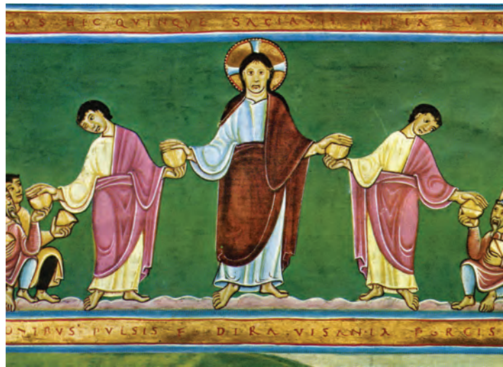
Het delen van het brood - uit een evangelieboek uit Echternach, rond 1040.

dat is een vrede die ons te boven gaat en uit wil stromen. Wie ben ik dat ik die mateloosheid zou beperken of blokkeren!