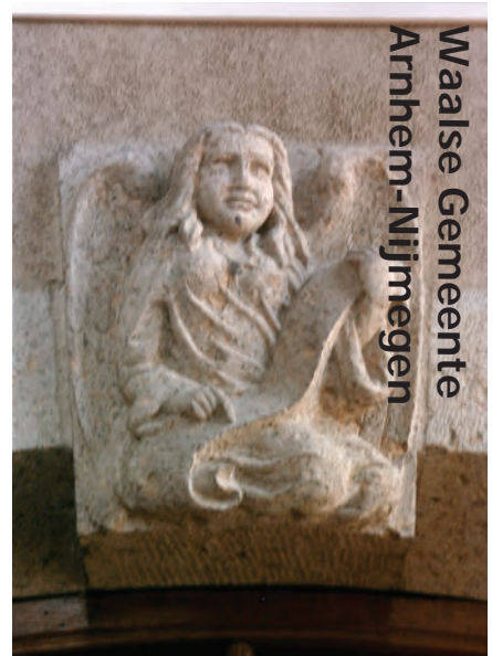
Waalse Gemeente Arnhem-Nijmegen