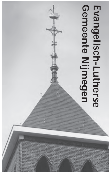
Evangelisch-Lutherse Gemeente Nijmegen