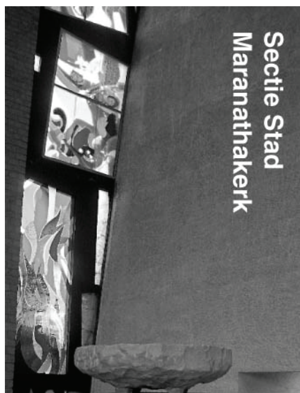
Secie Stad Maranathakerk