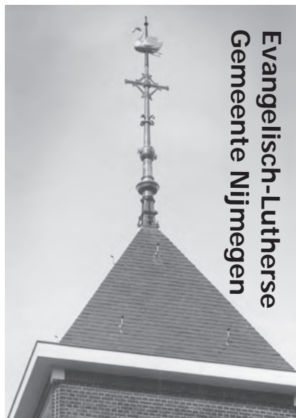
Evangelisch-Lutherse Gemeente Nijmegen

Ga hiervoor naar de website van PGN: www.pkn-nijmegen.nl (onderaan deze pagina vindt u een link naar de kerkdiensten)