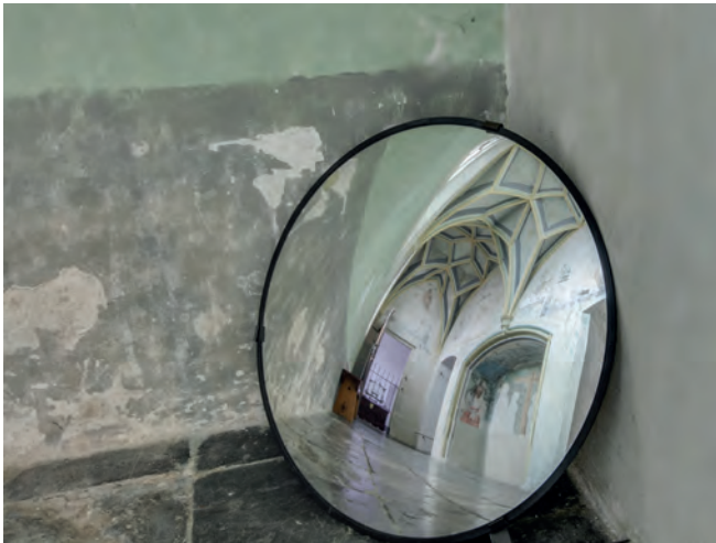
Heilige Grafkapel vanuit spiegel gezien