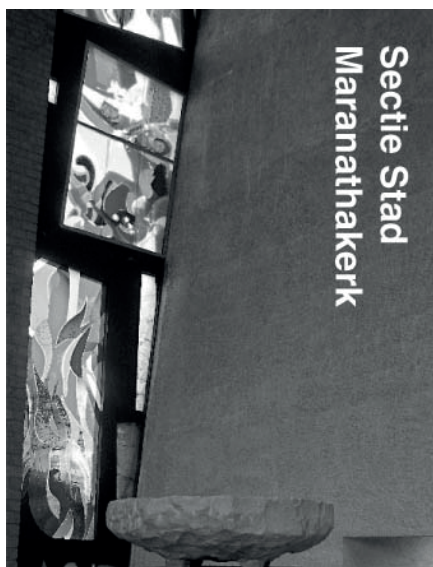
Secctie Stad Maranathakerk