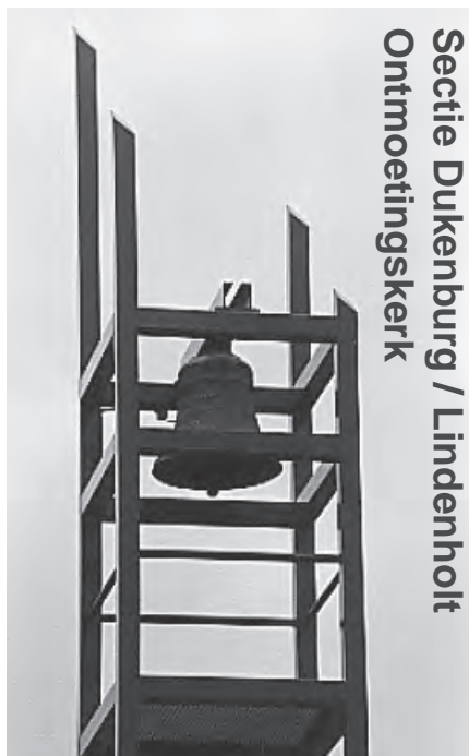
Secctie Dukenburg / Lindenholt Ontmoetingskerk

Meijhorst 70-33, 6537 EP, tel. 344 39 56