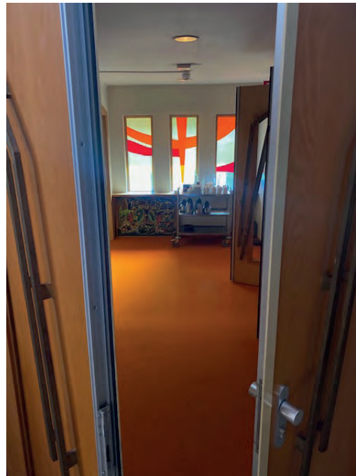
Kijkje door de deur van de kapel in de Pompekliniek

Een van onze koster heeft een paar weken geleden afscheid genomen, ik heb hem geïnterviewd voor deze bijdrage.