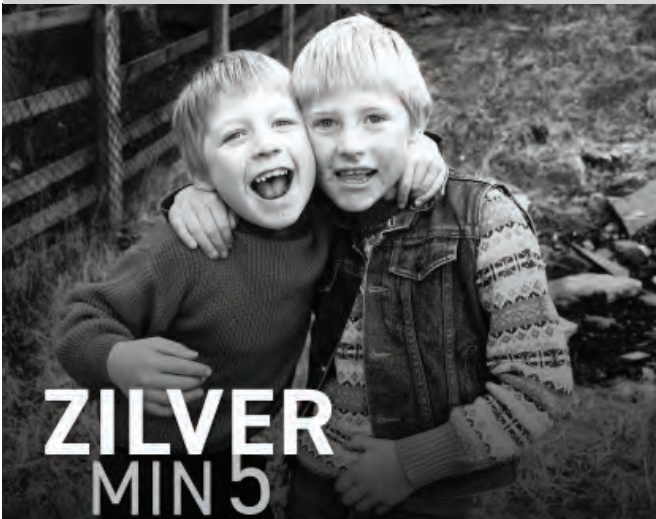
Foto-expositie van 25 - 27 oktober

Ter ere van het 20-jarig jubileum houdt de verBeelding de foto-expositie "ZILVER min5" op een prachtige locatie in thuisstad Nijmegen: de Noorderkapel van de Stevenskerk