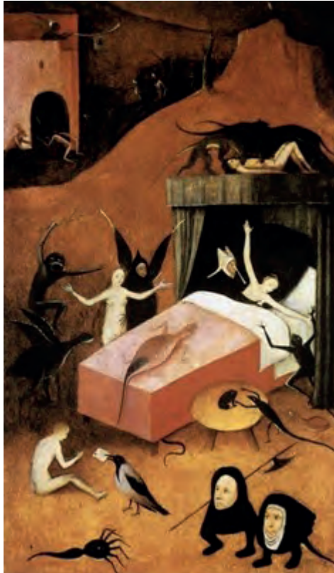
Jeroen Bosch, detail uit 'Het laatste oordeel'

Prediker, die oude brombeer, is met deze uitspraak aan de ene kant ontstellend relativerend, aan de andere kant staat hij niet voor niets bekend als de bijbelse sombermans-bij-uitstek. Want vrolijk worden we er niet van, van deze complottheorieën.