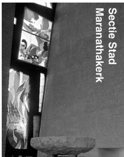
Secitie Stad Maranathakerk