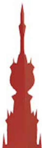
Oecumenisch Citypastoraat / Stadskerk Nijmegen

In het centrum zijn activiteiten van het Oecumenisch Citypastoraat in de