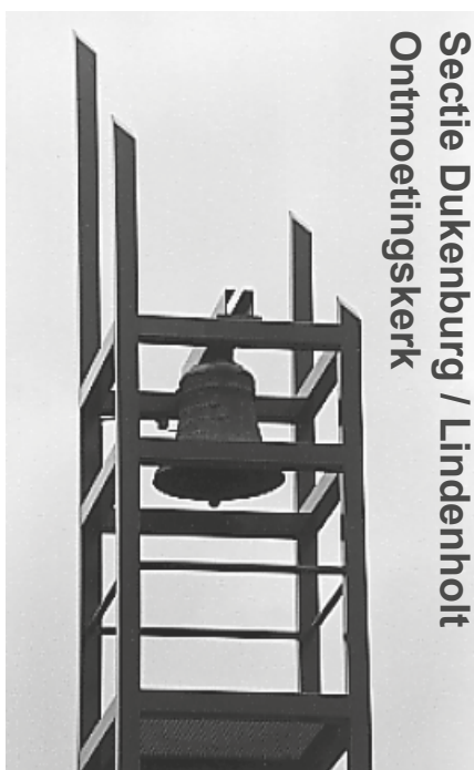
Secitie Dukenburg / Lindenholt Ontmoetingskerk

per e-mail: hendrik.jan.bosman@gmail.com