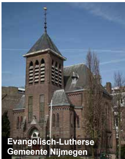
Evangelisch-Lutherse Gemeente Nijmegen