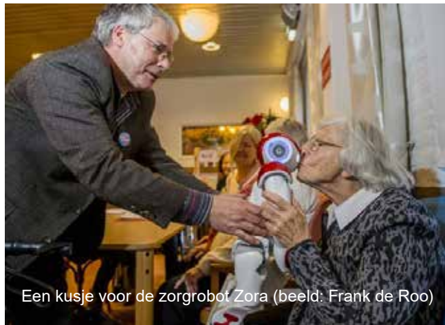
Een kusje voor de zorgrobot Zora

Een deel van mijn taak was ook de wetenschappelijke reflectie op ons werk. Daarom heb ik bij mijn afscheid een boek geschreven over het belang van de relatie tussen humaniteit en technologie in de zorg. Die twee moeten in goede zorg samen opgaan. Zeker nu kunstmatige intelligentie en de inzet van robots in de zorg steeds belangrijker worden is dat van belang. Want naast de technologische revolutie in de zorg die zich voor onze ogen voltrekt viel mij nog iets op. Ik merkte meer en meer hoe belangrijk het contact van mens tot mens in de zorg is.