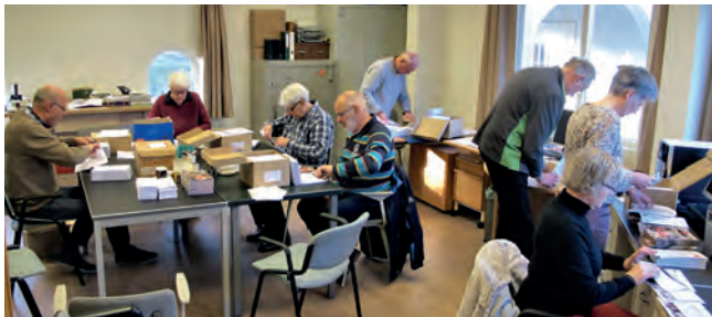
Vrijwilligers bereiden de Actie Kerkbalans voor

Het is de moeite waard om de kerk te ondersteunen: die rituele plek van transformatie en heelwording, waar zicht komt op en geproefd wordt van de vernieuwing van mens en schepping.